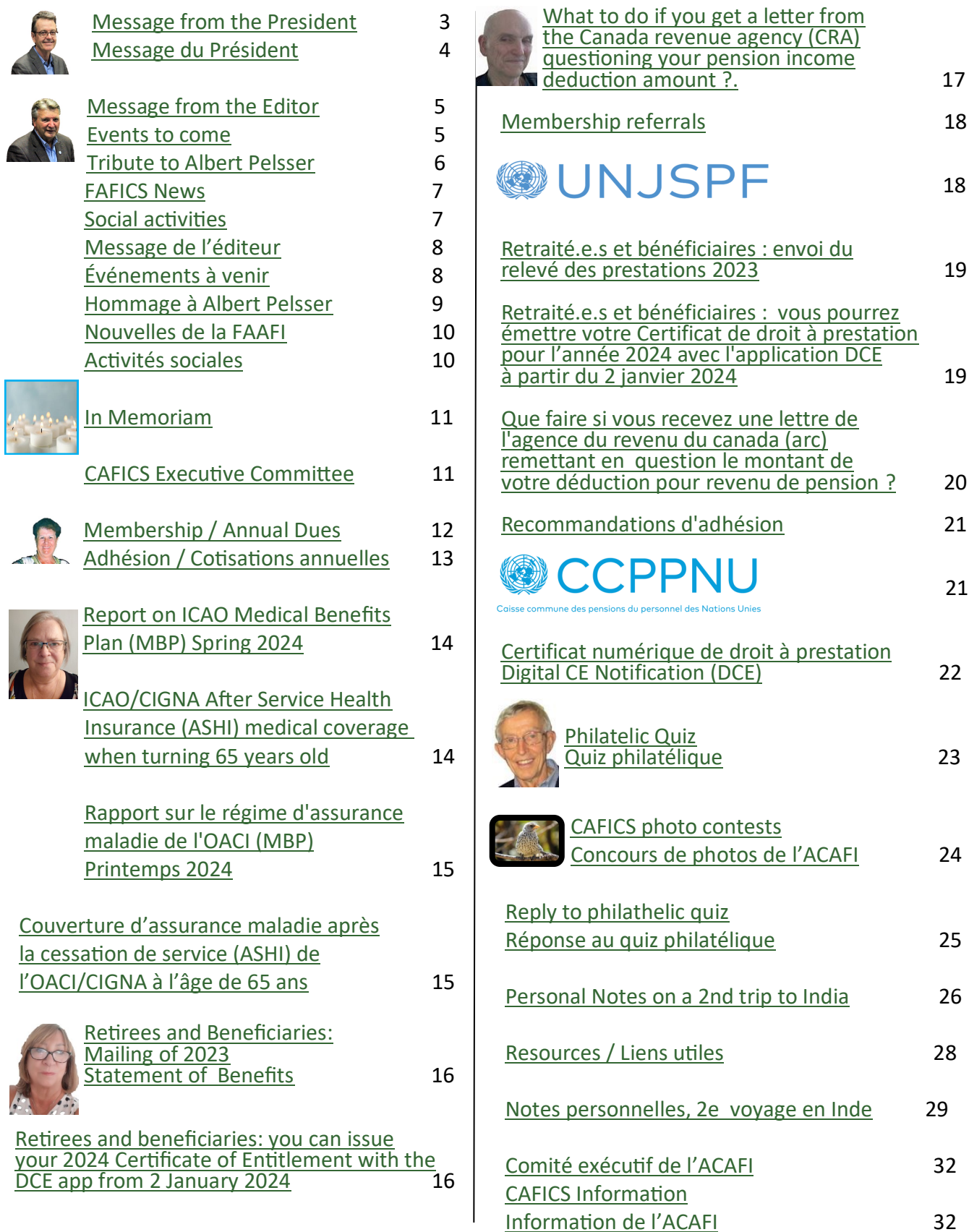
Table of contents—Table des matières