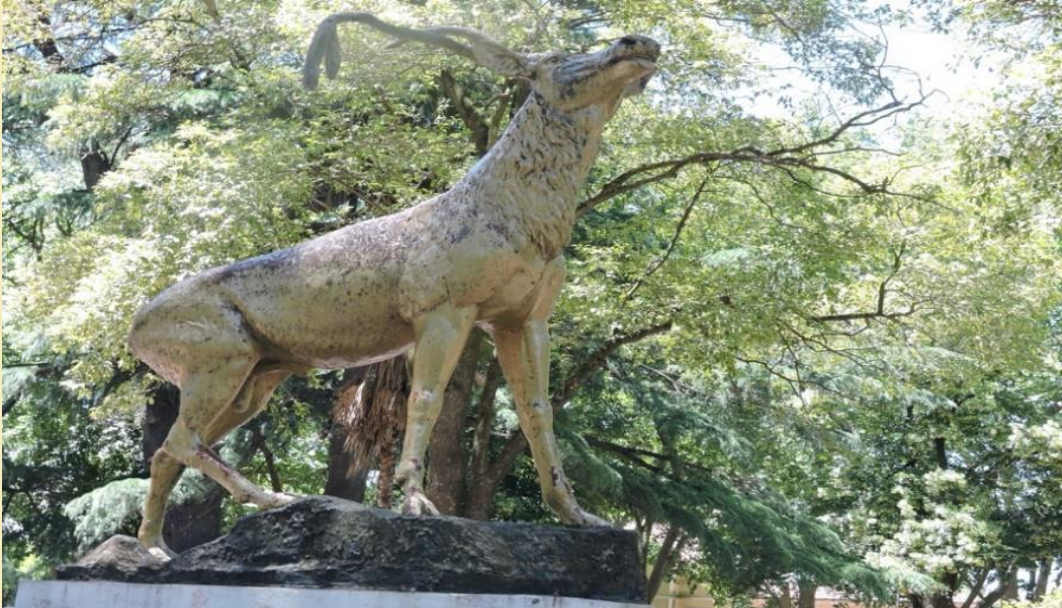
Ciervo. Osvaldo Zampini. AFICS Argentina.

Estatua de un ciervo, Plaza Azul, Provincia de Buenos Aires