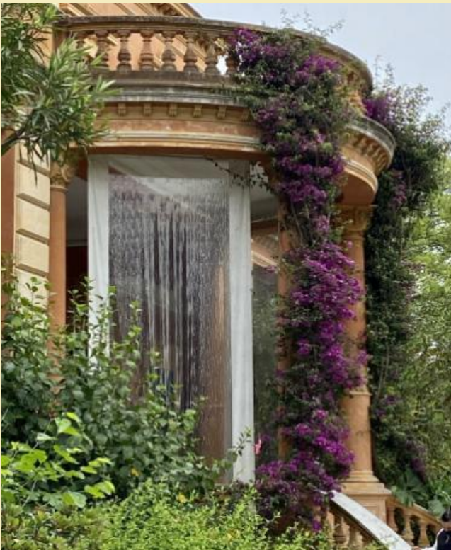
Casa de Victoria Ocampo

Balcón principal casa museo de Victoria Ocampo. San Isidro/ Beccar, Prov. Buenos Aires. Tomada el 31 de octubre, 2021, 12:30 h (día nublado).